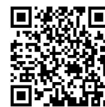
特种设备使用登记按单位办理申报操作指南