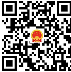
1. 尾矿库回采建设项目安全设施设计审查