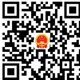
7. 生产经营单位生产安全事故应急预案备案