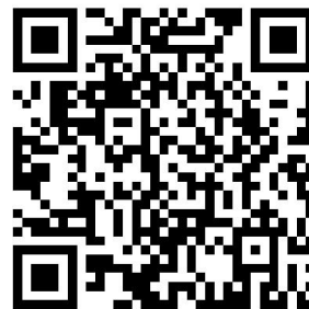
合规办事业务指南