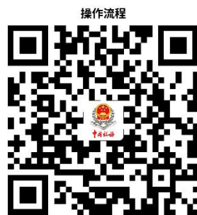
21.单位社会保险费申报

② 网上办 ：辽宁省电子税务局： https://etax.liaoning.chinatax.gov.cn/