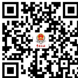
18.申报享受税收减免