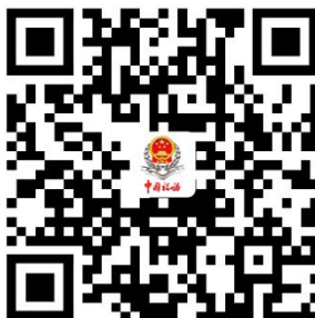
“免申即享”事项清单