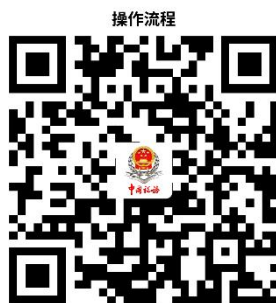
17. 房地产交易税费申报

② 网上办 ：辽宁省电子税务局： https://etax.liaoning.chinatax.gov.cn/